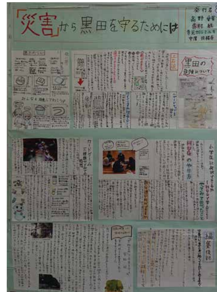
左上 小学校中学年の部 グランプリ