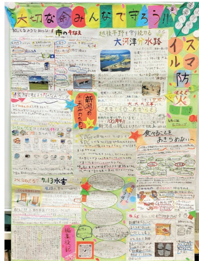
グランプリ 見附市立葛巻小学校 1組E 作品名：スマイル防災新聞