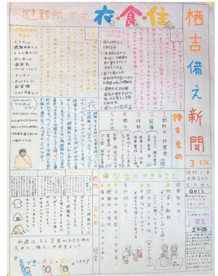
グランプリ 長岡市立栖吉中学校 3班 作品名：栖吉備え新聞